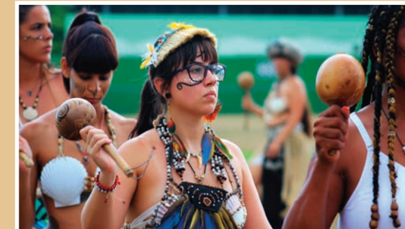
Miembros del Concilio Taíno Guatu-Ma-cu A Borikén en Guayanilla (Puerto Rico), 2017.