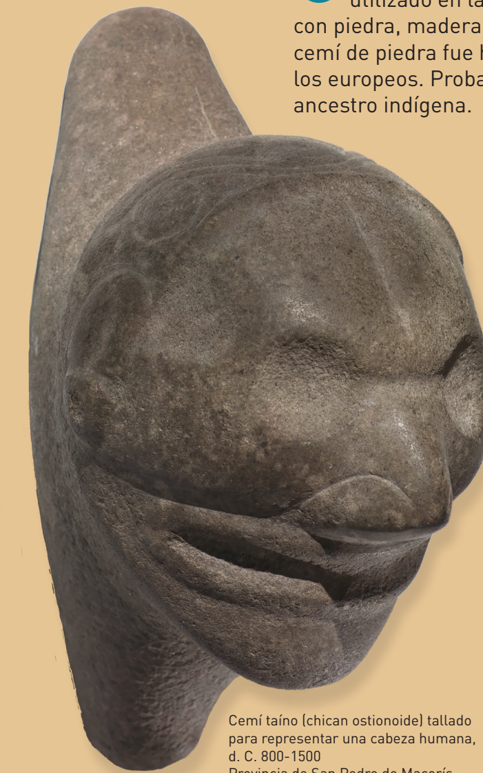
Cemí taíno (chican ostionioide) tallado para representar una cabeza humana, d. C. 800-1500. Provincia de San Pedro de Macorís (República Dominicana). Piedra. Adquirido en 1941 de A. E. Todd. NMAI 20/3511

Mira y aprende: Un cemí es un poderoso objeto espiritual utilizado en las ceremonias de los taínos. Se fabricaban con piedra, madera, algodón y otros materiales naturales. Este cemí de piedra fue hecho antes de que los taínos conocieran a los europeos. Probablemente, representa a un importante líder o ancestro indígena.