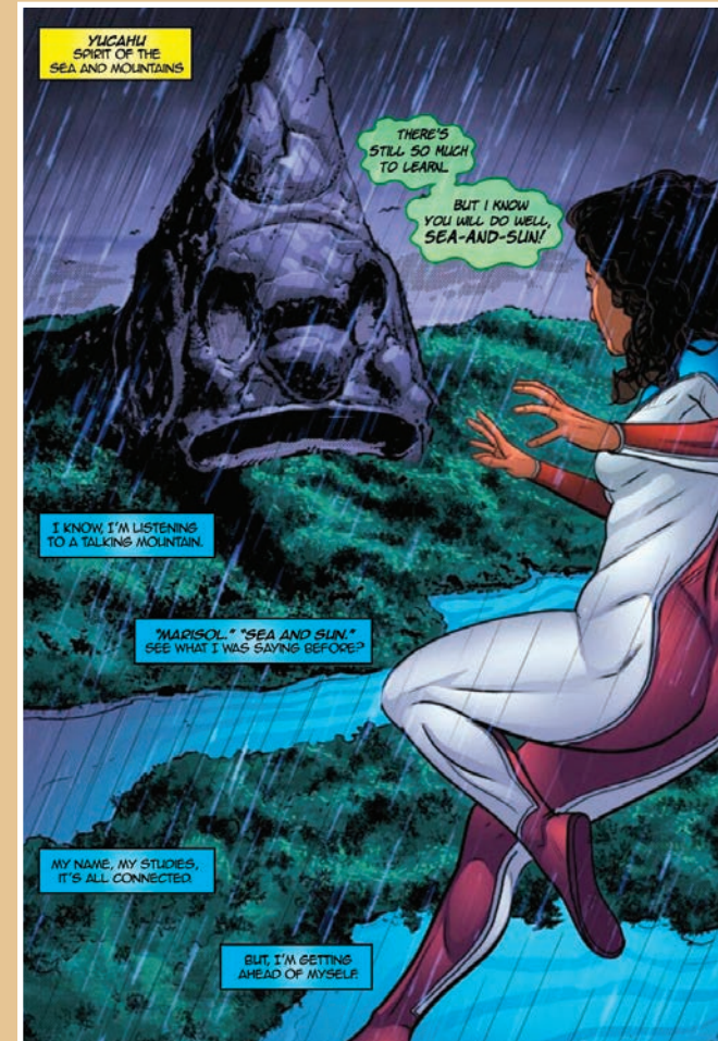
Ilustración por Will Rosado y colores digitales por Juan Fernández. © 2016 Somos Arte, LLC

Encuentra las conexiones: En la actualidad, los pueblos del Caribe todavía se inspiran en sus ancestros indígenas. Están volviendo a vincularse con su herencia indígena por medio de la recuperación de sus tradiciones locales y la conservación de sus recursos naturales. ¿Tienes algunas tradiciones que son importantes para tu familia? ¿Cómo te aseguras de que estas tradiciones no se pierdan?