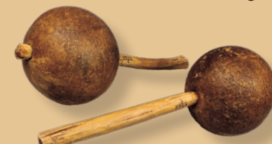
Las maracas, hechas con los frutos secos del higüero, son emblemas del legado musical del Caribe indígena. Maracas de baile de los taínos de Yara, ca. 1910. Baracoa (Cuba). Fruto del higüero, madera. NMAI 9/2264

Dato breve: Los taínos fabricaban objetos como maracas, cantimploras, tazones y cucharas con los frutos secos del higüero.